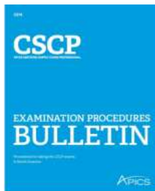
APICS CSCP Certification Bulletin